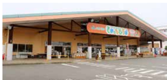
とれたっひろば 可児店

JAめぐみの直売所「とれたっひろば可児店」「とれたっひろば関店」では、ひるがの高原だいこんを販売しています。食育ソムリエの資格を持ったスタッフを配置しており、だいこんの特徴やおススメの食べ方などをアドバイスしていますので、お気軽にお声がけください。